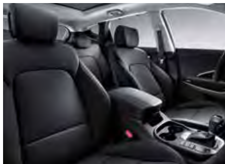
Čierna koža, jednofarebný (k dispozícii aj v látke)