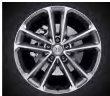
19-palcové zliatinové disky