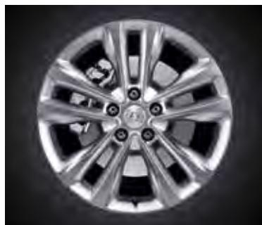
18-palcové zliatinové disky