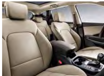
Béžová koža, dvojfarebný (k dispozícii aj v látke)