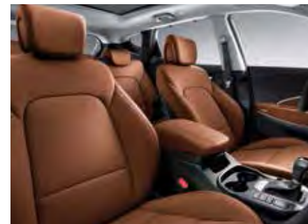
Hnedý kožený komplet