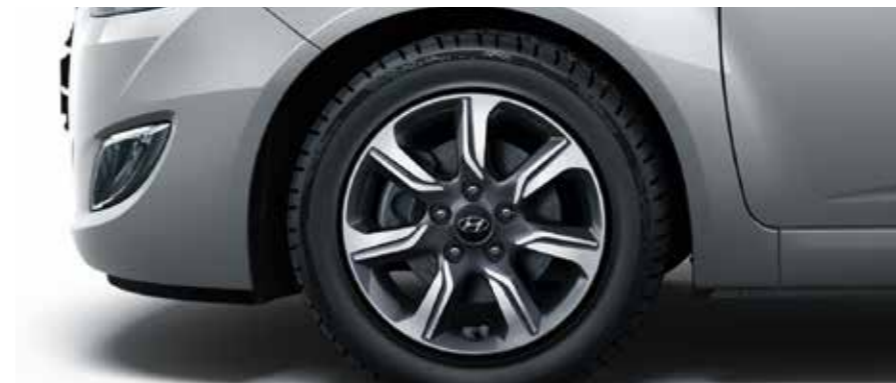
16-palcové zliatinové disky