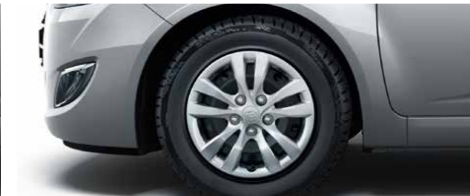
15-palcové oceľové disky